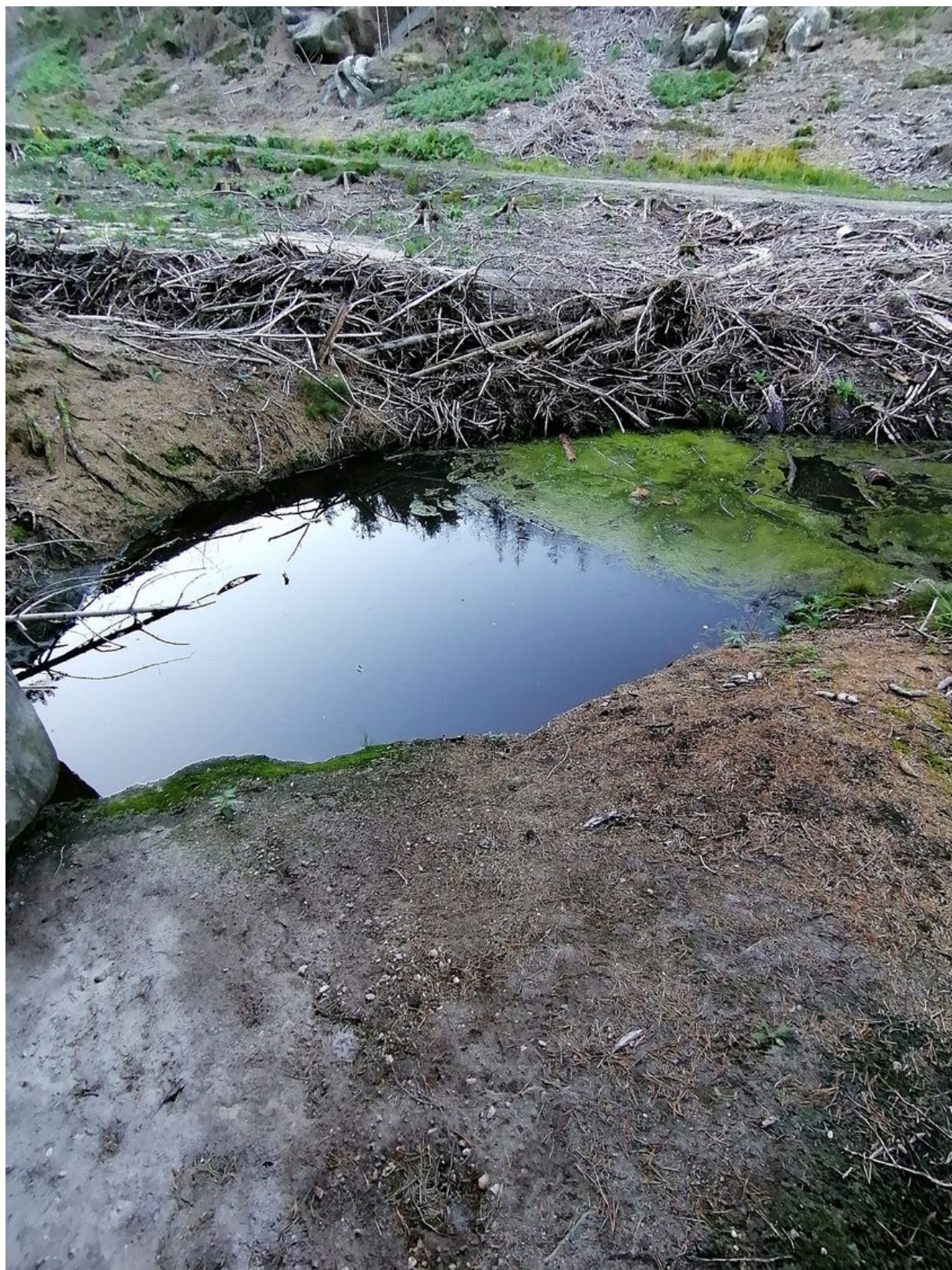
Obrázek č. 1/3