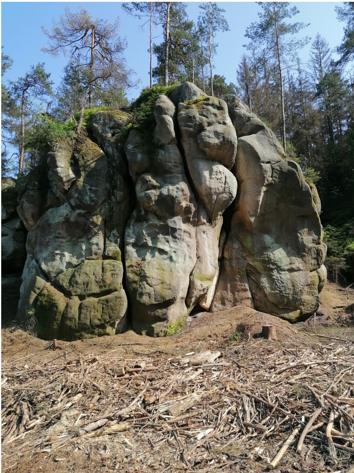
Obrázek č. 1/4

(pohled z dálky, zdrž je v pravé části snímku dole)